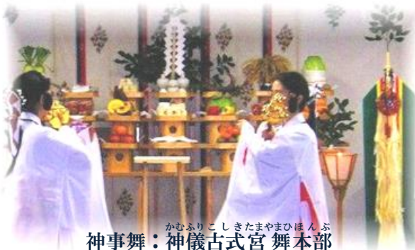
神事舞：かむふりこしきたまやまひほんぶ 神儀古式宮舞本部