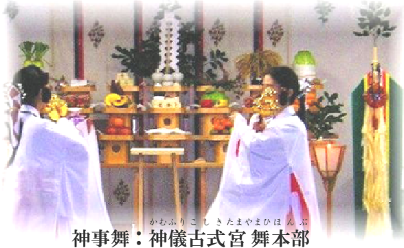
かむふりこしきたまやまひほん 神事舞：神儀古式宮 舞本部